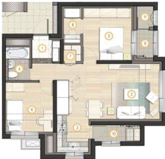
주택타입 : 49B